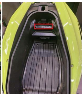
محل قرارگیری شماره شاسی