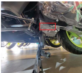
محل قرارگیری شماره انجین

برای داشتن سفری ایمن، دوام و عملکرد مناسب موتورسیکلت و کاهش انتشار گازهای سمی، کنترل دوره ای صحیح امری ضروری است.