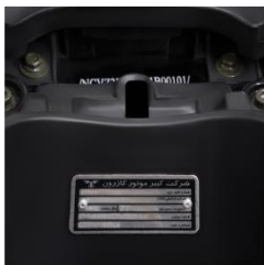
محل حک شماره شاسی

پس از تحویل موتورسیکلت در اولین قدم شماره سریال بدنه و انجین را با سند مالکیت مطابقت داده و در صورت وجود اشکال سریعاً به واحد صدور سند شرکت کبیر موتور اطلاع دهید.