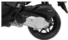
محل حک شماره انجین